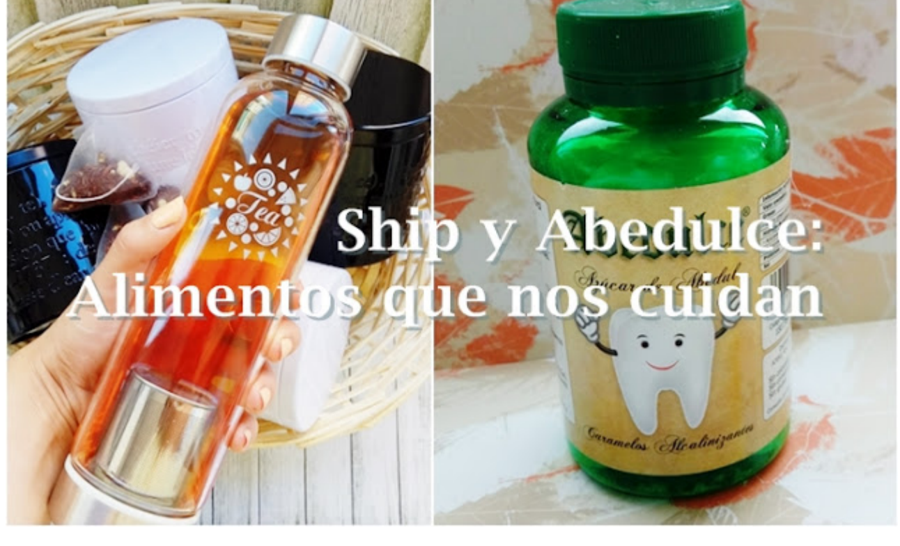
¿Nos sumamos a la tendencia Cold Infusion ?

Hoy os traigo un mix con dos productos alimenticios para cuidarnos. Los té Ship y los caramelos Abedulce .